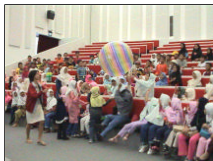
Gembira bermain bola dalam permainan "Discovery Square".