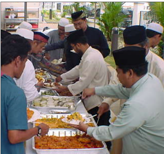
Pada Hari Raya Aidil Fitri umat Islam dikehendaki berbuka dan haram berpuasa.