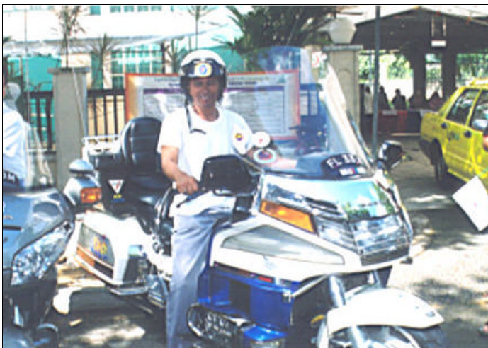
Muatan berharga... Dalam perjalanan menghantar hidangan teristimewa.

Ini adalah salah satu program Ramadan MUIS, dimana memberi peluang kepada masyarakat untuk membuat kerja kebajikan dan wadah untuk berbakti kepada mereka yang kurang bernasib