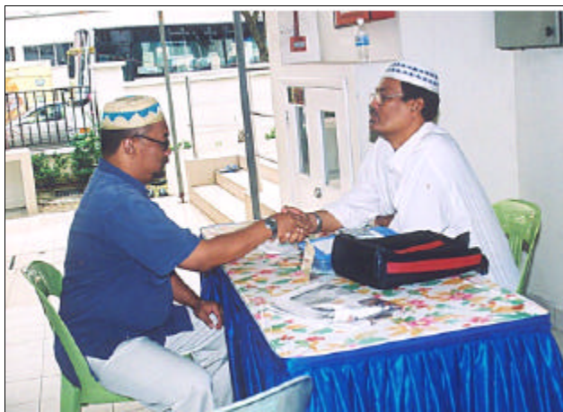
Menunaikan zakat fitrah adalah wajib.

umat, di samping itu mereka berpeluang bertakbir (mengagungkan Allah) beramai-ramai, mendengar khutbah Aid yang penting, berzikir dan mengaminkan doa yang dibaca oleh imam. Mereka yang tidak uzur berpeluang mendirikan solat Hari Raya.