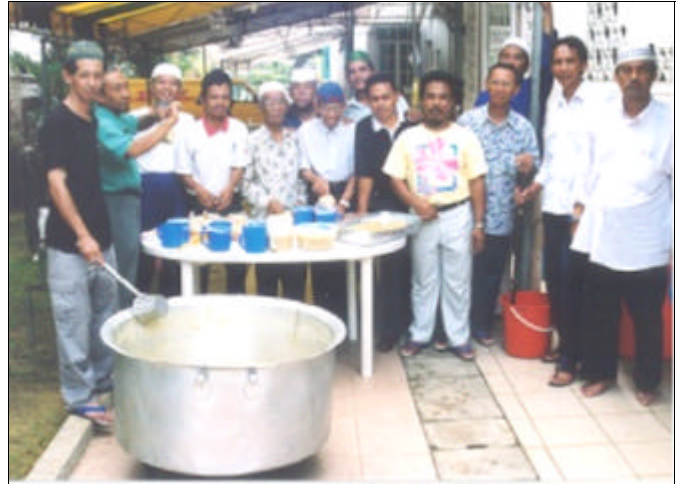
Bubur Ramadan Al-Istiqamah... Komoditi ‘hangat’ di bulan puasa.

Kami rasa terhormat di atas kesudian Pejabat Mufti yang mengatur majlis perjumpaan untuk para ulama Singapura di Masjid Al-Istiqamah pada hari Jumaat, 21