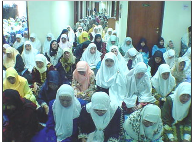
Tua, muda, lelaki, perempuan disunatkan menghadiri solat Aid.

Waktunya bermula dari ghurub matahari akhir Ramadan dan berterusan sepanjang malam Hari Raya hingga solat