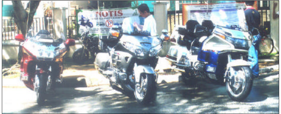
Menunggu arahan... Sebahagian dari pasukan yang siap sedia untuk menjalankan tugas.

baik. Masjid Al-Istiqamah telah dipilih sebagai salah satu pusat projek tersebut pada hari Sabtu, 8 November 2003.